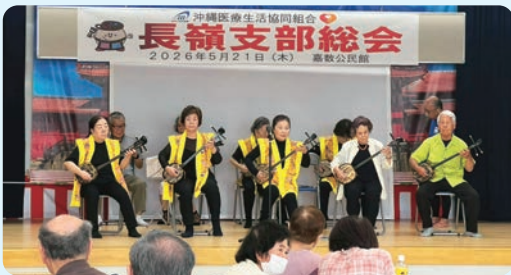
長嶺支部総会後の2部での三線演奏 (5月21日)