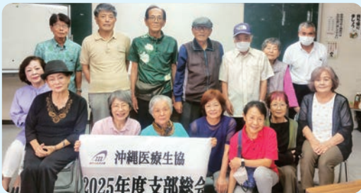
やえせ支部総会 (5月16日)