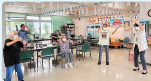
首里西支部総会後の2部での健康体操 (5月24日)