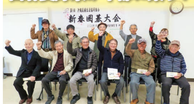
参加者でガッツポーズ

「囲碁大会」を開催しました。今大会は組合員活動の機会均等を図るべく初の中部地域での開催となり、11名の参加者が4組に分かれ熱戦を繰り広げました。