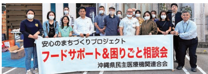
安心のまちづくりプロジェクト フードサポート&困りごと相談会 沖縄県民主医療機関連合会