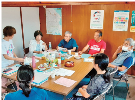
うるま具志川北支部 ゆんたく会・健康チェック