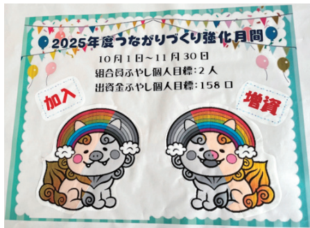
医療生協本部では加入・増資がふえるとぬり絵のようにマスコットに色がつく