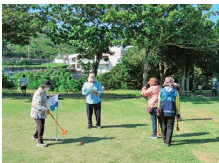
豊見城ブロックグラウンドゴルフ大会 117名参加 (11/22)