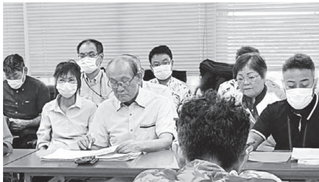
沖縄市で発言する参加者

「年金や高齢者の生活支援」では高齢者の補聴器助成をする自治体は増加しており、更なる拡充を訴えました。移動の問題等情報共有しました。市に対しては「公共サービスの拡充と働く世代へ支援策」として非正規職員の勤勉