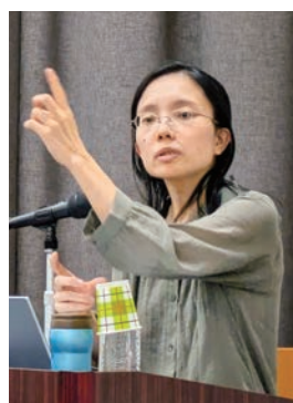
講話を行う雨積小児科医

講話では子どもの発達とスマートフォンの利用の関わりについて、様々な角度からわかりやすいお話がありました。便利さの裏にある注意点として、乳幼児から使用させることによる発達の遅れや学