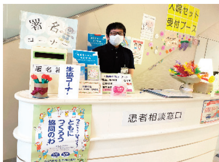
沖縄協同病院の生協コーナーで加入・増資を訴える

「つながりづくり強化月間」は、10月1日スタート集会をかわきりに、各支部や事業所で様々な取り組みが行われています。 健康チェックで、医療生協の宣伝を行い、加入・増資につなげた支部や、ブロックでグラウンドゴルフ大会を開催して組合員の交流と増資につなげています。