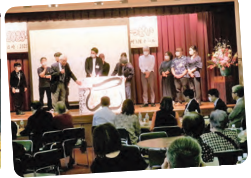
真和志地域合同新春のつどい 156名参加 (1月26日)

12月に医療福祉生協連主催の健康づくり委員長会議に参加しました。「つながり」をキーワードに健康を考え、改めて医療生協の活動の素晴らしさを確認することができました。4生協からの取り組み紹介、班を中心とした健康づくりの講演、人生100年時代における健康長寿の講演がありました。それに基づきグループで討議交流しました。共通課題は、健康習慣をい