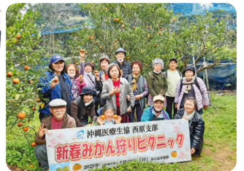
西原支部新春みかん狩りピクニック 16名参加 (1月19日)