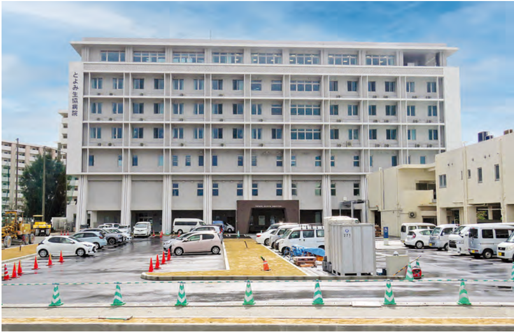
3月には180台の駐車場がフルオープン

とよみ生協病院が新病院として開院し2月で1年を迎えました。この間地域組合員、地域住民に病院を利用頂き、とよみ生協病院の入院、外来、健診事業は大きく展開してきました。