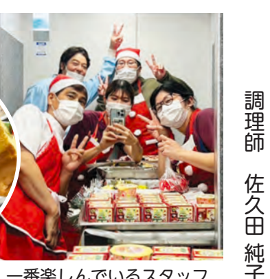
一番楽しんでいるスタッフ

インの日に手作りプリンを提供予定です。患者さんより喜びと感謝のお言葉をたくさん頂きました。