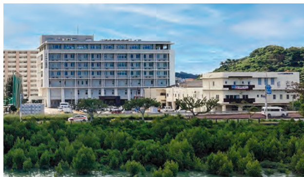
漫湖のほとりからのぞむとよみ生協病院

た。しかし新病院はできたものの、この1年間駐車場の確保が出来ず来院される皆様には臨時駐車場の利用でご迷惑をお掛けしました。現在、旧病院の解体を終え、外構工事を1月末までには完成させ、2月に工事完了の許可が行われ、3月からは駐車場が使用できることとなります。駐車台数は141台と既存（透析室下）の駐車場を合わせると180台の駐車場を完備することに