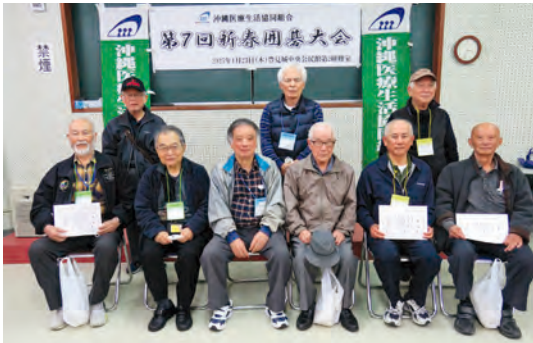
入賞したみなさん

閉会式では、大城委員長から各組の入賞者に賞状と賞品が授与されました。参加者からは「楽しかった、力量を上げて来年も参加したい。囲碁班を結成したい」などの感想も寄せられました。なお、3名が組合員に加入、2名から増資があり