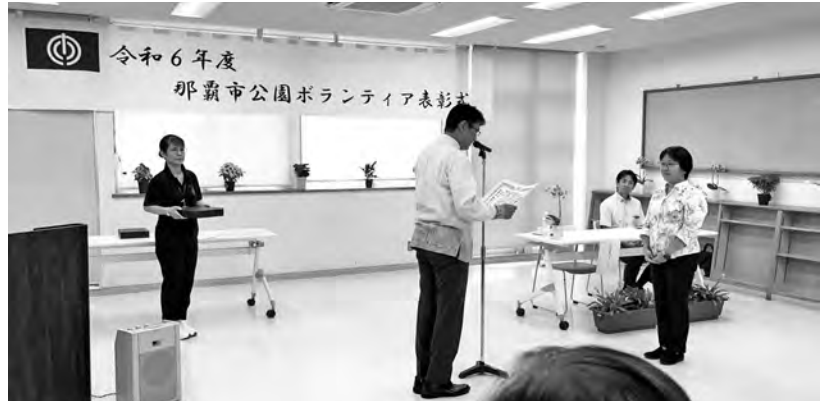
沖縄医療生協ボランティア委員会は、2008年10月沖

縄協同病院の移転を機に、那覇市公園ボランティア(企業)と協定を交わして、奇数月の第2土曜日午後1時から1時間程度、漫湖公園内の清掃(煙草の吸殻や飲料缶の片づけ、枯葉の除去等)をおこなっています。