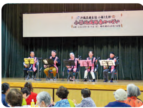
小禄地域新春のつどい 65名参加 (1月19日)