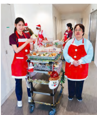
病棟に現れたステキなサンタ

とよみ生協病院栄養管理室では毎月1回、行事やイベントに合わせて、様々な一品を提供しています。昨年のクリスマスは手作りのシフォンケーキとロールケーキ(特別な甘味料を使用)を用意し、栄養管理室とリハビリ、総務課のスタッフに協力してもらい、サンタの衣装を着て各病棟の患者さんにケーキ(サンタの折り紙とメッセージカード)をお届けしました。