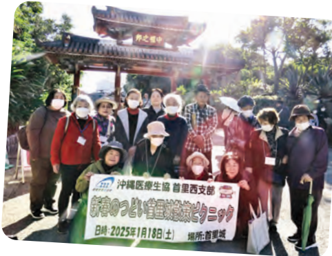
首里西支部新春首里城散策 15名参加 (1月18日)