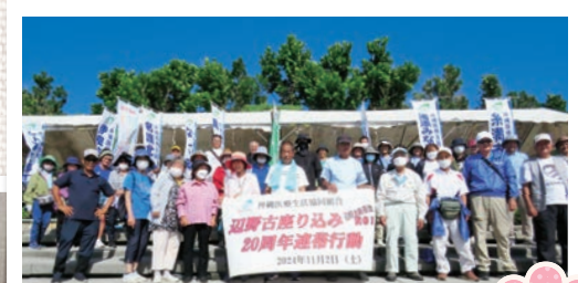
辺野古座り込み20周年連帯行動