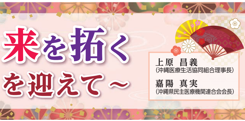
上原 昌義 (沖縄医療生活協同組合理事長) 嘉陽 真実 (沖縄県民主医療機関連合会会長)