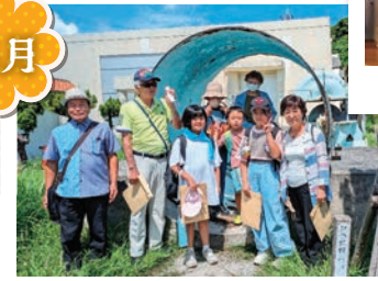
SDGs西原浄水場見学会