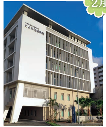
とよみ生協病院開院