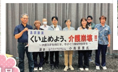
介護ウェブのつどい