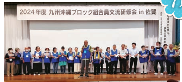
2024年度九州・沖縄ブロック組合員交流研修会