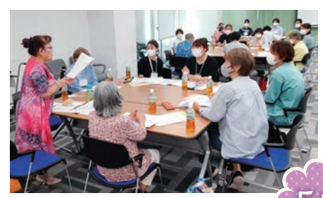
2024年度班活動交流集会