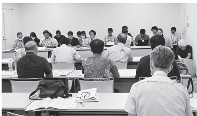
無低診など社会保障の改善に向けてのキャラバン

沖縄医療生活協同組合、沖縄県民主医療機関連合会(沖縄民医連)は、国に対して保険調剤薬局への拡大を求める