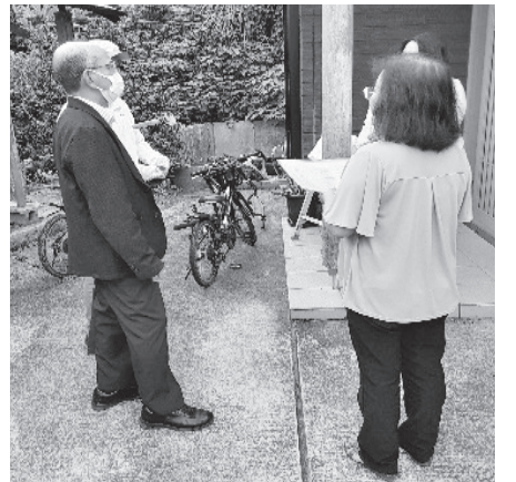
地域組合員と職員組合員がいっしょに行動

つながりづくり強化月間で訪問していますが、住所不明組合員の確認や、加入・増資の呼びかけも合わせて行いました。引き続き支部運営委員と協力し、目標達成できるよ