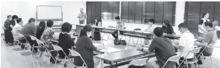
北中城村とのキャラバンの様子

月22日には社保協提出の陳情書「訪問介護費等報酬引き上げ」が県議会で全会一致で採択。重要な到達をみんなの力で切り拓いています。その他、県政と共同し、国保統一期限を明示させず国保税引き上げ抑制、子ども医療費や学校給食の無償化、生活保護ポス