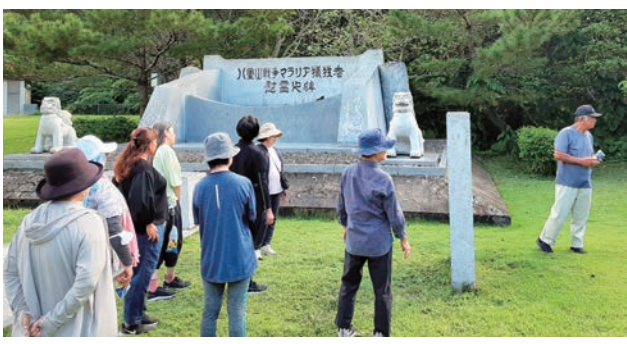
八重山戦争マラリア犠牲者慰霊之碑で学習する参加者

2020年3月に「子ども食堂すまいるカフェ北谷」を立ち上げて今年で5年目に入りました。