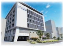
とよみ生協病院 豊見城市真玉橋593-1

健康をつくる、平和をつくる、いのち輝く社会をつくる 沖縄医療生活協同組合 本部 〒901-0205 豊見城市字根差部588-3