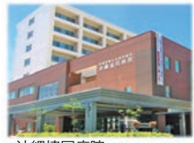
沖縄協同病院 那覇市古波蔵4-10-55