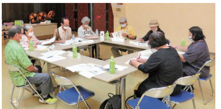
グループワークで月間のとりにくみを話し合う参加者