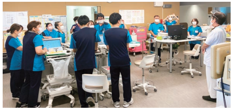
病棟スタッフのミーティング

もうひとつの課題が経営です。新病院建設による大きな投資があり、まだまだ厳しい経営状況が続いています。打開の手だてとして今重要なことは、事業所間の連携です。沖縄協同病院からの入院患者受け入れ、とよみ生協病院よりかりゆしの里、わらていーだなどの介護施設への紹介、協