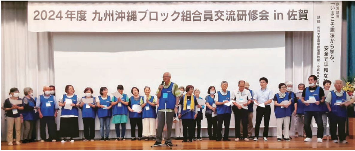
2024年度 九州沖縄ブロック組合員交流研修会 in 佐賀

7月16～18日に行われた九州沖縄ブロック組合員交流研修会in佐賀に沖縄から41名が参加しました。全体で382名でした。