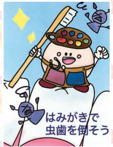
仲元 ひまわり (沖縄市 中1)