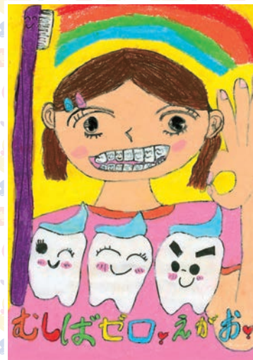
金城 琴羽 (豊見城市 小2)