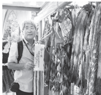
石川にじの家からの千羽鶴を届けました(県原水協 佐事務局長)

8月の4、5、6日の3日間2018年原水禁世界大会in広島に参加し、最も強く感じた事は世界平和を願う思いは世界共通であるという事でした。海外の代表として世界23か国から総勢98名の方が来日されていましたが、その方々との勉強会の中で、あるアメリカの方が「私の国が日本に原爆を落とし、今でも沖縄を始め日本各地に基地を構えている事にとっても申し訳な