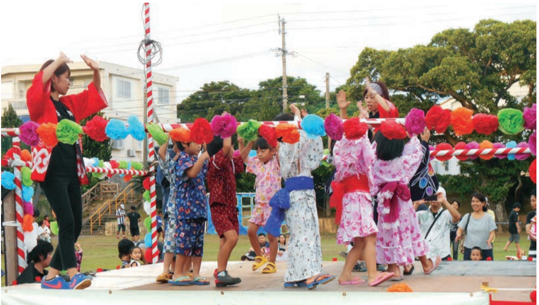
「城岳地域盆踊りの夕べ」が8月18日(土)、城岳中央